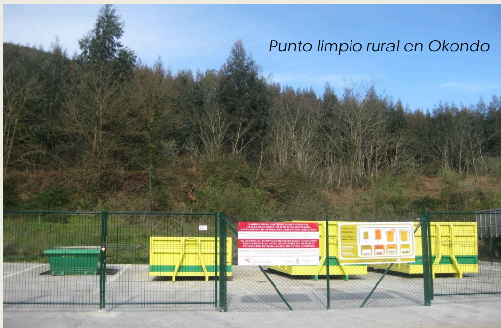
Punto limpio rural en Okondo

Punto Limpio-Garbigune ubicado en Laudio , abierto de lunes a domingo; con más de 8,000 usuarios, abierto a vecinos mancomunados y vecinos de Orozko y Arakaldo. 500 t/año aprox.